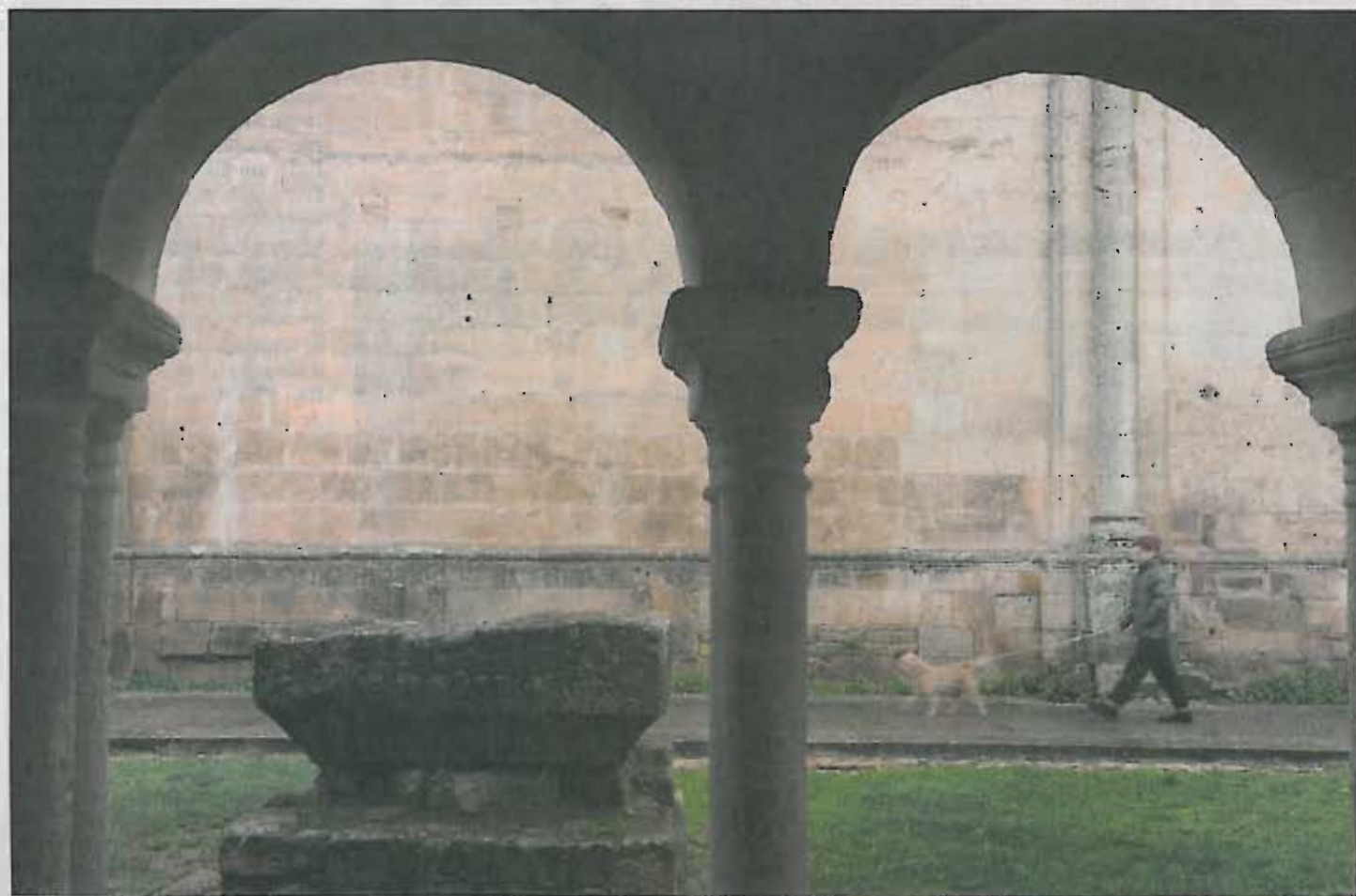
Les façades aux appareillages rectilignes ont été restaurées, mais il restait à réoccuper les lieux.